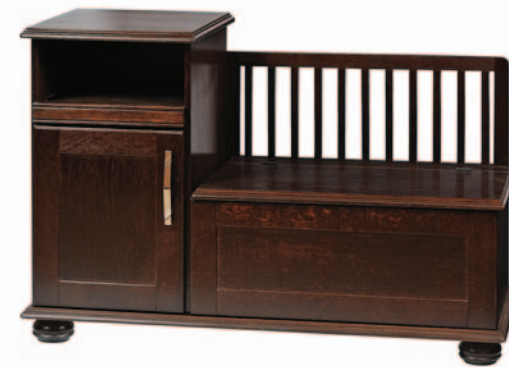
Тумба под телефон «Карина» пр. ВМФ-5035 H1230 / L820 / B427