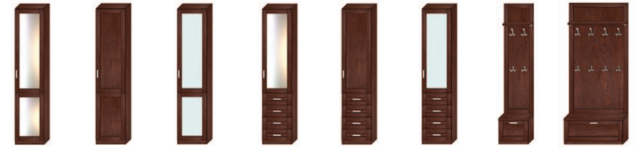
0138/З 482 / 2250 / 380 0156/З 482 / 2250 / 560 0138/М 482 / 2250 / 380 0156/М 482 / 2250 / 560 0138/С 482 / 2250 / 380 0156/С 482 / 2250 / 560 0238/З 482 / 2250 / 380 0238/М 482 / 2250 / 380 0238/С 482 / 2250 / 380 0938 482 / 2250 / 380 1938 (полка) 965 / 2250 / 380