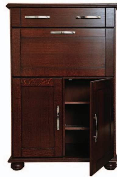
Тумба для обуви «Карина» пр. ВМФ-5040 H1300 / L870 / B375