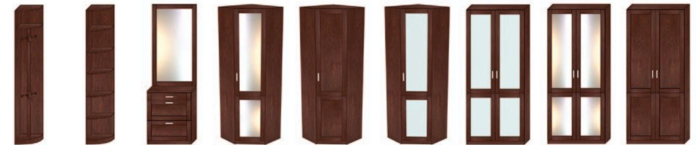
0838 380 / 2250 / 380 0638 380 / 2250 / 380 1838 734 / 2250 / 380 0738/З 747 / 2250 / 380 0738/М 747 / 2250 / 380 0738/С 747 / 2250 / 380 1138/С 964 / 2250 / 380 1156/С 964 / 2250 / 560 1138/З 964 / 2250 / 380 1156/З 964 / 2250 / 560 1138/М 964 / 2250 / 380 1156/М 964 / 2250 / 560